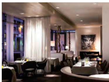
Hotel Pullman Eindhoven Cocagne