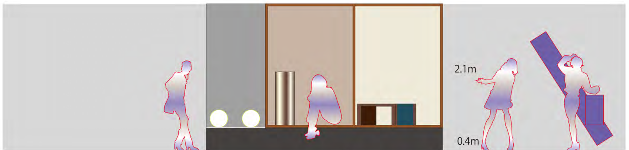
▲立面図 S : 1/40

仕上材： 壁：和紙（季節寄せ からかみ屋）ワイヤーテンション張り W1450mm 壁：極細オーガンジー フデシッテクス ステンレスのスパッタリング （サンコロナ小田） W1450mm 柱梁：ウォールナット付板（胡桃） 軸 カーボンファイバー角パイプ 20×20mm