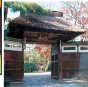
入母屋茅葺屋根の正門 (名古屋市都市景観重要建築物)